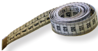
Metro a nastro

In questo documento illustriamo qual è il metodo per rilevare i valori in maniera tale da ottenere un preventivo di spesa attendibile.